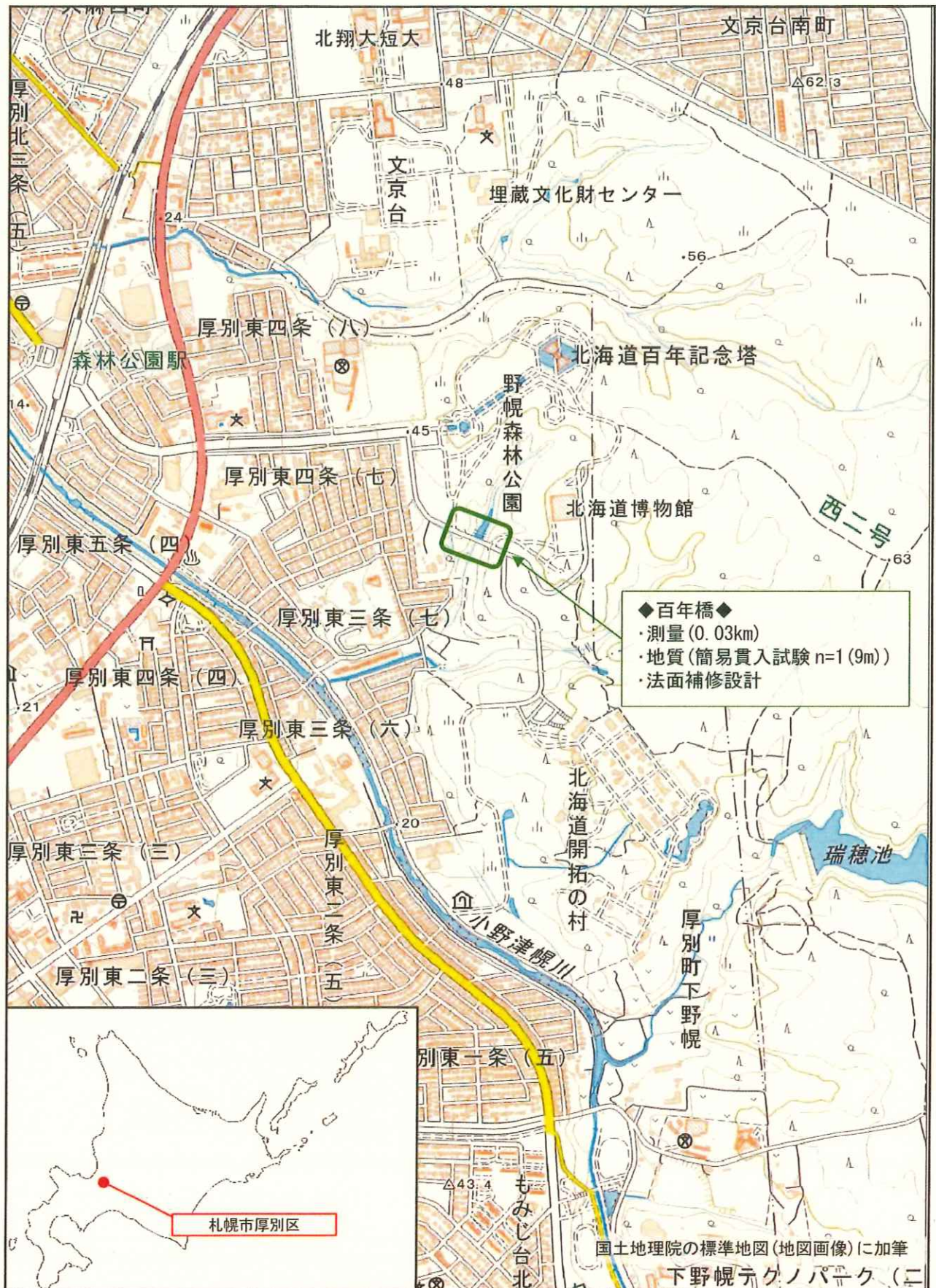
図 1.1 業務位置図 (nonscale)